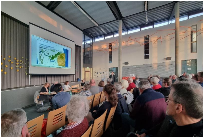
Einwohnerversammlung 08.04.2025

Der Strom der bereits genehmigten zwei WEA soll über Erdkabel bis zu einem der Masten der bestehenden 110 kV-Freileitung geleitet auf der Gemarkung „Christinental“ auf Probsteierhagener Gebiet. Dort soll auch ein neues Umspannwerk gebaut werden, das für die weiteren WEA erforderlich wird. Die 110 kV-Freileitung kann in ihrer aktuellen Kapazität nur den Strom der zwei bereits genehmigten WEA abnehmen. Für die sechs zusätzlichen WEA, muss eine zusätzliche Beseilung in die Freileitung eingezogen werden, damit wird 2027/2028 gerechnet. Die Errichtung der gewünschten zusätzlichen WEA ist davon abhängig.