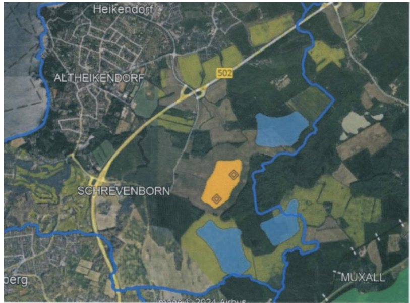
Vorrangflächen (gelb), Potentialflächen (blau)

Auf Vorrangflächen können Windkraftanlagen ohne Genehmigung und Beteiligung der betroffenen Kommunen oder Bürger*innen errichtet werden, da das Land bereits alle möglichen Beeinträchtigungen abgeprüft hatte.